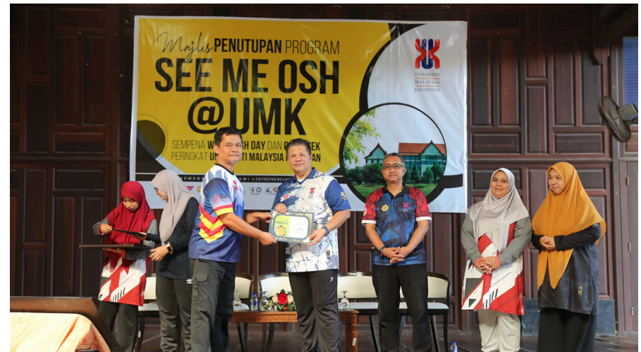
TEMPAT KETIGA: FAKULTI PERUBATAN VETERINAR