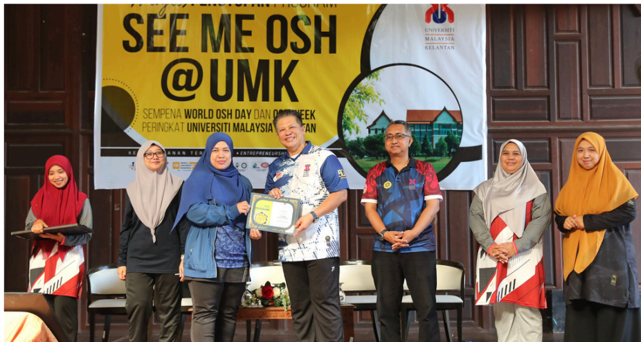
TEMPAT KEDUA : PEJABAT PENDAFTAR