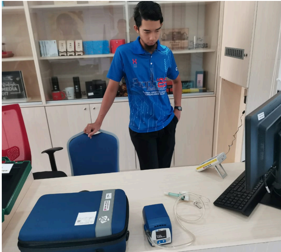
Pemantauan Kualiti Udara Dalam (IAQ) di Galeri Canselori, UMK Bachok