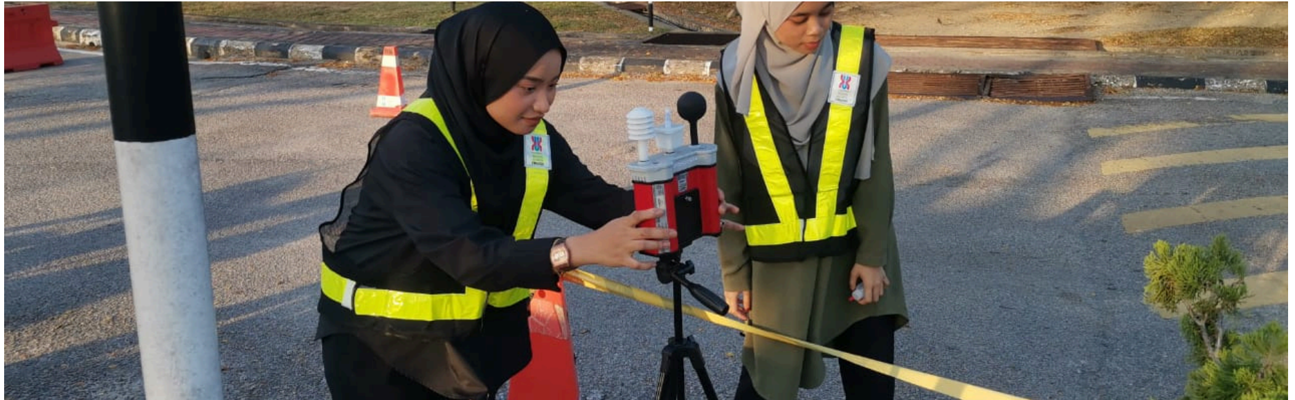
Pemantauan Bunyi Bising di Fakulti Perubatan Veterinar, UMK Kampus Kota

Pemantauan Kualiti Udara Dalam di Bahagian Keselamatan, UMK Bachok