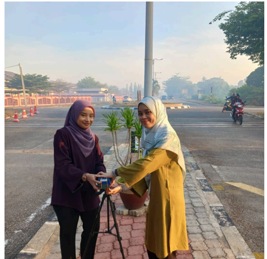
Pemantauan Kualiti Udara Dalam (IAQ) di Bahagian Keselamatan, UMK Bachok