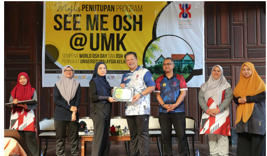
TEMPAT PERTAMA : FAKULTI SENIBINA DAN EKISTIK

Pertandingan ini terbuka kepada semua PTj/ Fakulti. Kriteria pertandingan merangkumi hebahan yang dipamerkan di ruang safety corner termasuklah dasar KKP, carta organisasi JPKKP PTj, maklumat emergency response plan (ERP) dan turut dinilai adalah dari segi kreativiti dan inovasi.